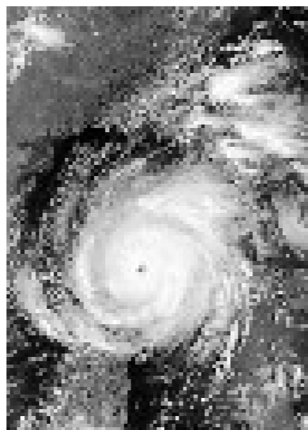
Hurricane Rita über dem Golf von Mexiko.