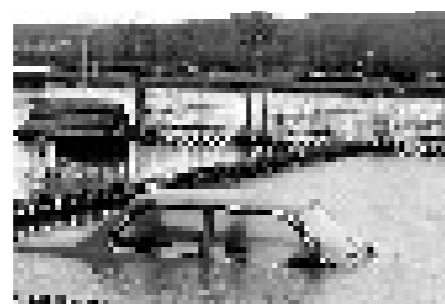
Solche Bilder könnten zum Alltag werden, wenn die Klimaerwärmung so weitergeht.