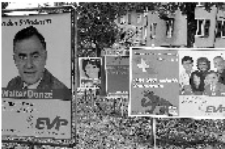
Die blau-gelben EVP-Wahlplakate stachen im Plakatgewirr positiv hervor.