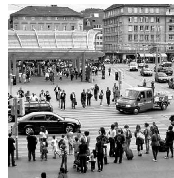
Bahnhofplatz heute: Fussgänger und Autos im Konflikt.