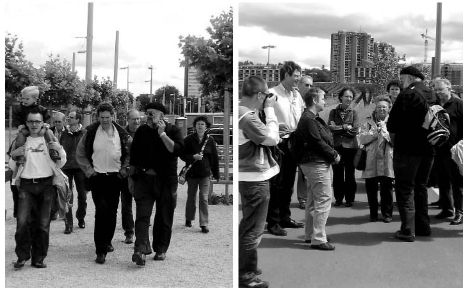
Unterwegs werden Gespräche geführt, Fragen gestellt und manch Neues erfahren.

Am Samstag Vormittag, dem 6. Juni, trafen sich rund 15 Interessierte zur Führung "EVP unterwegs in Bern West" in der EMK-Kapelle Bümpliz. Nach Kaffee und Gipfeli ging es los